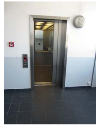
Abb. 5) Ausreichender Zugang für eine ECFanGrid

Soll ein alter Ventilator gegen einen großen riemen- oder direktgetriebenen Ventilator getauscht werden, ergeben sich häufig nahezu unüberwindbare Hürden. Das Gebäude ist nicht selten im Laufe der Zeit weiter gewachsen, sodass der Zugang zu den Technikzentralen erschwert ist. Wenn sich die Zentrale auf dem Dach befindet, muss der neue Ventilator mit einem Kran eingebracht werden, was zusätzliche Kosten bedeutet. Bei gemauerten Kanälen kann es erforderlich sein diesen komplett einzureißen und anschließend wieder neu zu mauern. Aus diesen Gründen war eines unserer Hauptaugenmerke bei der Entwicklung des ECFanGrid Systems die einfache Einbringung. Sie können ohne Probleme vorhandene Treppen und Aufzüge nutzen und passen mit dem Material durch jede Türe. Der gesamte Umbau lässt sich mit zwei Personen bewältigen. Künftige Tausche können innerhalb weniger Minuten getätigt werden.